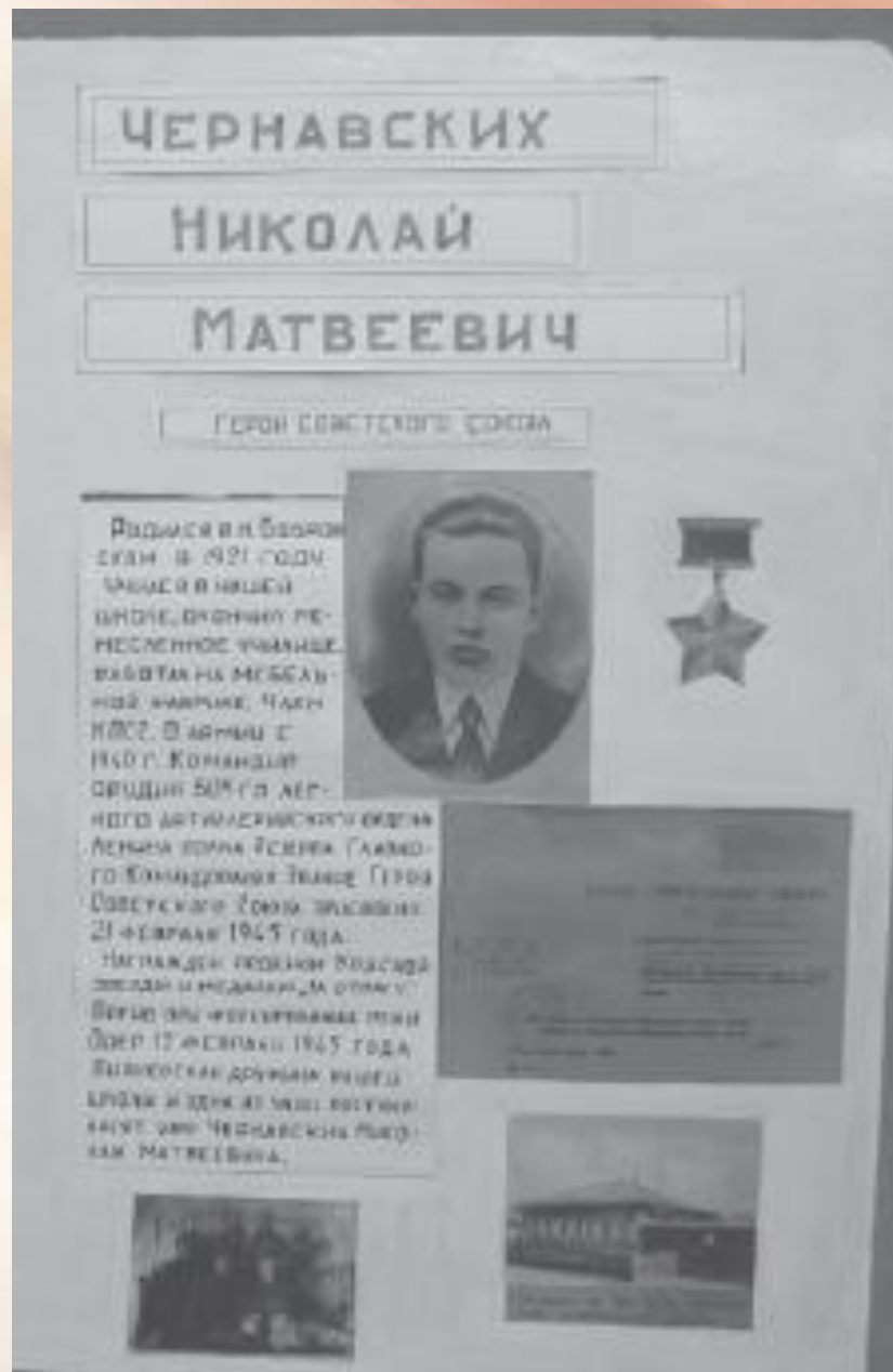
Стенд в музее «Боевой и трудовой славы бобровчан»